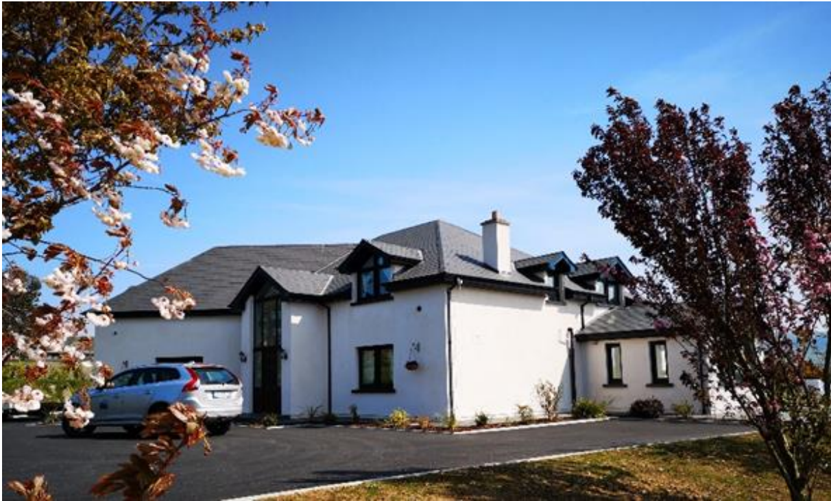
easycruiser.tours Gästehaus und Tourbasis